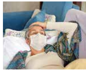
○ ليلى غوفن خلال إضرابها عن الطعام الذي استمر ٢٠٠ يوم عام ٢٠١٨.

وكان الكونجرس قد حدد منتصف أيلول الأحد الاثنين موعداً للتحول إلى اتفاق لمنع إغلاق الحكومة. وقال النائب الديمقراطي سبندي هوير الرجل الثاني في مجلس النواب، إنه يتوقع تمرير الاتفاق الاثنين بل نقلاً من مجلس الشيوخ. وهذا يعني أنها تظلت فترة تنص على أنها إجراء مؤقت وقها ترامب في وقت تقدم من يوم الأحد لواصله تمويل الحكومة الفدرالية ١٤ ساعة إضافية وتجنب الإغلاق. وكان مجلس النواب والشيوع وانفا على الإجراء المؤقت في وقت سابق الأحد. وقال شورير وبيولوسي في بيان إن «مجلس النواب سيجري بسرعة لتعريف الحد للشرع في الفور لإرساله إلى مجلس الشيوخ مع أي مكتب الرئيس لتوقيعه». وأضاف أنه مع التسارع المروع للعدوى والوفيات اليومية لمرض هذا وقت ضيقه. ورحب الرئيس المنتخب جو بايدن الذي وعد بتعريف حزمة جديدة عندما يتولى منصبه في يناير. بالافتقار لكنه رأى أنه يجب بذل جهود إضافية. وقال في بيان: «على الفور بدءا من العام الجديد، سيكون على الكونجرس العمل لدعم خطتنا الخاصة بفيروس كوفيد-١٩ ودعم الأسر المتضررة، والاستثمار في الوظائف والتعافي الاقتصادي».