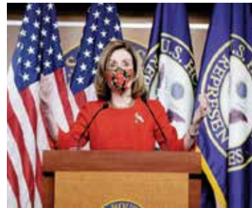
○ بيولوسي ادى اعلانها الاتفاق للمصلحين.

واشنطن - (أ ف ب): أعلن أعضاء الكونجرس الأمريكي يوم الأحد على حزمة بقيمة ٩٠٠ مليار دولار لمساعدة ملايين الأمريكيين المتضررين من كوفيد-١٩ بعد أشهر من الجدل بينما تواجه الولايات المتحدة أكبر نقاش للواء في العالم. وتشمل هذه الحزمة مساعدات لتوزيع اللقاح والخدمات اللوجستية وامتنيازات إضافية للعاملين في العمل بقيمة ٣٠٠ مليار دولار في وجوه جديدة من شيكات التحفيز بقيمة ٥٠٠ دولار -تصنف المبلغ المقدم في الشيكات الموزعة في مارس. ويعد أشهر من المناقشات والجدل الحزبي ونجاح الائتمانات حتى خلال مفاوضات اللحظة الأخيرة، نوصي المشرعون في اتفاق قائلوا إنهم يأملون في إبرامه رسماً الاثنين. وجرت المفاوضات خلال حملة الانتخابات الرئاسية الأمريكية المثيرة للجدل ورفض دونالد ترامب الاعتراف بالهزيمة فيها. وقال ميتش ماكونيل زعيم الأقلية الجمهورية في مجلس الشيوخ في بيان: «التفقا على حزمة تعليق قيمتها حوالي ٩٠٠ مليار دولار. إنها مليئة بالسياسات المحددة الأهداف لمساعدة الأمريكيين المتعثرين الذين انتظروا بالفعل وقتاً طويلاً». وأكدت رئيسة مجلس النواب الديمقراطي