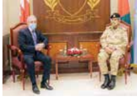
حضر اللقاء اللواء الركن حسن محمد سعيد مدير ديوان ضباط دفاع البحر.

استقبل المشير الركن الشيخ خليفة بن أحمد آل خليفة القائد العام لقوة دفاع البحرين، بالقيادة العامة صباح أمس الإثنين ٢١ ديسمبر ٢٠٢٠، السيد شاهين بن سناكر عبد اللابيف سفير جمهورية أذربيجان لدى مملكة البحرين والمقيم في الرياض.