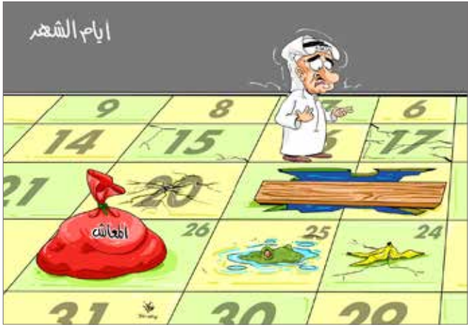
كارطون: بوب خياط المال البلاد

إذا كانت الموازين والمعايير تتغير بين جيل وآخر، فإن المعادن الثمينة هي التي لا تتغير بهذا التغيير شيئاً، وهذا ما ينطبق على مسيرة التعليم في مملكة البحرين في شتى المجالات وعلى مختلف الأصعدة، فالحكومة الموقرة تولي اهتماماً خاصاً لعملية تطوير التعليم وغرس القيم التربوية من خلال الخطط المدروسة وتنفيذها، ولهذا فصوره مملكة البحرين في التقارير الدولية صورة مشرفة، كيف لا وهي تحصد الجوائز والمراتب العليا بصفة مستمرة على مستوى دول العالم، وأخر الإنجازات حصول البحرين على المرتبة الثانية ضمن 13 دولة شهد مستواها تقدماً ملموساً في اختبار الرياضيات للصف الثامن، في هذه الدورة من الاختبارات لعام 2019، مقارنة بالدورة السابقة في 2015، وفي المركز الثاني ضمن 11 دولة في العلوم للصف الثامن، في اختبارات TIMSS العالمية للرياضيات والعلوم، التي أعلنتها الرابطة الدولية لتقييم التحصيل التربوي IEA، وكذلك فوز مملكة البحرين بجائزة سمو الشيخ سالم العلي الصباح للمعلومية، في دورتها العشرين المقامة بدولة الكويت الشقيقة، وذلك عن