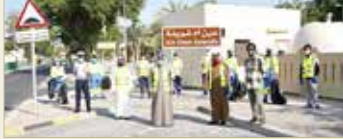
المتنمة - وزارة الداخلية

تفسيذ مبدأ الشراكة المجتمعية، عبر إشراك كل مؤسسات المجتمع المدني في المبادرات الاجتماعية والحملة التوعوية التي تبناها المحافظة الجنوبية، بهدف رفع ثقافة وعي المواطنين والمقيمين بضرورة الحفاظ على نظافة المواقع الطبيعية وحماية الرفعة الخضراء في جميع مناطق المحافظة الجنوبية.