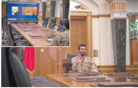
ناصر بن حمد آل خليفة على وقفة سموه معهم، متمنين لسموه دوام التوفيق والنجاح.

تفاعل سمو الشيخ ناصر بن حمد آل خليفة ممثل جلالة الملك للأعمال الإنسانية وشؤون الشباب مع نداء زوجة الشاعر والأديب البحريني علي الشرقاوي، حيث أجرى سموه اتصالاً مرئياً مع الشوقاوي وزوجته الشاعرة فحبة عجلان. وأعرب سمو الشيخ ناصر بن حمد آل خليفة عن تقديره لجهود البرازة التي قدمها الشاعر والأديب البحريني علي الشوقاوي ومكانته البرازة في الأدب والشعر وحرصه على تأكيد مكانة المملكة في هذا الجانب عبر الصرح الكبير الذي قدمه طوال مشواره الأدبي. وأشار سمو الشيخ ناصر بن حمد آل خليفة إلى أن مخزجات الشعر والأدب في البحرين تتجسد في مخزجات المواطن البحريني وحرصه على رفع علم المملكة خفاً في المحافل الثقافية والشعرية وغيرها، وهو ما جسده المواطن علي الشوقاوي خلال مشواره الأدبي. وخلال الاتصال المرئي ناقش سمو الشيخ ناصر بن حمد آل خليفة العديد من الأمور، متمنياً سموه للعائلة كل التوفيق والصحة والعافية.