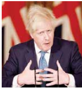
○ جونسون متحدثاً بعد اجتماع خلية أزمة حكومته لمناقشة تعليق دول الطيران مع بريطانيا.

الرياض - الوكالات: أعلنت دول خليجية أمس تعليق كافة الرحلات الجوية وإغلاق حدودها البرية والبحرية بسبب ظهور سلالة جديدة من فيروس كورونا المستجد في المملكة المتحدة، دفعت دولاً أخرى في العالم إلى تعليق الرحلات الأمتدادية من هذا البلد. ولاً خلال الأسابيع الأخيرة انتشرت سلالة جديدة من فيروس كورونا في بريطانيا، كما جرى تسجيل إصابات بهذه الطفرة خارج الأراضي البريطانية، ولا سيما النمسا وهولندا وأستراليا. وفي الرياض، نقلت وكالة الأنباء السعودية عن مصدر مسؤول في وزارة الداخلية عن الأحد الاثنين قولها إن قرار إعادة الإغلاق جاء بمثابة علم على وزارة الصحة عن انتشار نوع جديد من فيروس كورونا المستجد في عدد من الدول. وتنص معلومات طبية عن طبيعة هذا الفيروس، وأوضح المسؤول أن المملكة قد «تعلق» سبعة الرحلات الجوية الدولية للمسافرين -إلا في الحالات