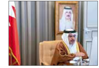
سمر ولي العهد رئيس الوزراء

لا تغييرات في إجراءات القادمين من بريطانيا طيران الخليج تغلق الرحلات للمكويط وعمان أعلنت شركة طيران الخليج - الناقل الوطنية لمملكة البحرين عن تعليق جميع الرحلات من وإلى دولة الكويت حتى الأول من يناير 2021. كما أعلنت عن تعليق جميع الرحلات من وإلى سلطنة عمان حتى 29 ديسمبر 2020. من جانب آخر أكدت سفارة البحرين في المملكة المتحدة للمسافرين إلى البحرين من المملكة المتحدة أنه يعد تصنيف لندن على المستوى الرابع ضمن نظام المستويات فإنه لا يوجد حالياً أي تغييرات لإجراء السفر للقادمين من بريطانيا، حيث تقوم الجهات المعنية بإجراء الفحوصات اللازمة لكل مسافر يصل للبحرين.