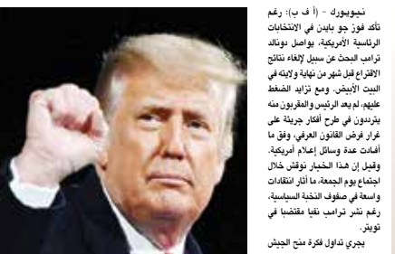
○ دونالد ترامب.

نيويورك - (أ ف ب): رغم تأكد فوز جو بايدن في الانتخابات الرئاسية الأمريكية، يواصل دونالد ترامب البحث عن سبل لإلغاء نتائج الاقتراع قبل شهر من نهاية ولايته مع البيت الأبيض. ومع تزايد الضغط عليهم من بعد الرئيس والغربون منه بتزوير في طرح أرقام جريئة على غرار لرض القانون العرفي، وفق ما أفادت عدة وسائل إعلام أمريكية. وقبل أن هذا الخيار نواش لن اتفاق اجتماعي للجمعة، ما أثار انتقادات واسعة في صفوف النخبة الكونجرس - رغم نشر ترامب نفاً لقطبها في نوفمبر. بحري تناول فكرة فتح الجيوش المسلحة التفتيشية والقضائية من مطلع ديسمبر في نوآر مشرقياً منذ ترامب الأثر حماساً له، ما سيجب وفقاً لهم بتكليف المؤسسة العسكرية بتنظيم اقتراع رئاسي جديد. لا تستعمل الحكومة الفدرالية القانون العرفي منذ الحرب العالمية الثانية. ووفق دراسة أجراها مركز بريمان للعدالة، نشرت في أغسطس، يتطلب ذلك حصول ترامب على موافقة من الكونجرس. وقال السيناتور الجمهوري بيت رومني على شاشته سي إن إن، الأحد إن هذا لن يحصل، وبالتالي لن يحقق كل تلك أي نتيجة. على ترامب الخيار الأحدث، وتكثرت في تغريدته «القانون العرفي خير