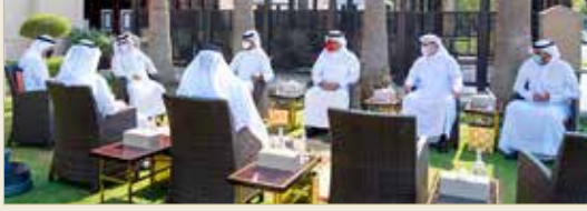
سمو ولي العهد رئيس الوزراء عضو المجلس التنفيذي لإمارة أبوظبي رئيس مكتب أبوظبي التنفيذي

◆ سمو ولي العهد رئيس الوزراء يؤكد تنامي الروابط بين البلدين