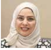
رئيسة مجلس النواب

أعربت رئيسة مجلس النواب فوزية زينل عن بالغ التقدير وعظيم الامتنان بالتوجيهات الملكية السامية بقيام الجهات المعنية بالملكة بتعويض البحارة البحرينيين المتضررين جراء الإجراءات المتخذة من قبل السلطات القطرية، والمباشرة في حصر الأضرار وصرف التعويضات. وثمنت النواب الكويفية لعوقف مجلس النواب المعبر عن الموقف الشعبي في التأكيد على أهمية التفاوض الثنائي المباشر مع دولة قطر للوصول إلى اتفاق بشأن استمرارية السماح للصيادين بالمدلين من ممارسة نشاطهم وفق ما هو متعارف عليه منذ عقود وبما يعود بالخير على مواطني البلدين ويعزز من التعاون الخليجي المشترك. وأشارت زينل إلى أن مجلس النواب سيجسد في جلسته اليوم بياناً تفصيلياً بشأن الموقف التبادلي الداعم لحقوق الصيادين البحرينيين، وحماية مصدر رزقهم، والحفاظ على المهنة التي توارثوها من الأباء والأجداد، ومارسوها بكل أمن وأمان.