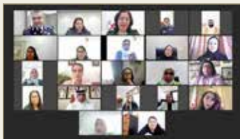
الرفوع - المجلس الأعلى للمرأة

من العنف الأسري من خلال مناقشة مستجدات رصد وتنفيذ المؤسسات الوطنية المعنية لمحاوّر الاستراتيجية الوطنية لحماية المرأة من العنف الأسري منذ إنطلاقها في عام 2015 وفي ظل الظروف الراهنة والصعوبات والعوائق التي واجهتها الجهات