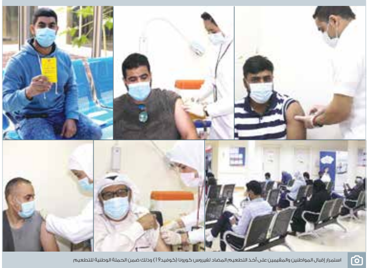
استمرار إقبال المواطنين والمقيمين على أخذ اللقاح المضاد لفيروس كورونا (كوفيد 19) وذلك ضمن الحملة الوطنية للتطعيم